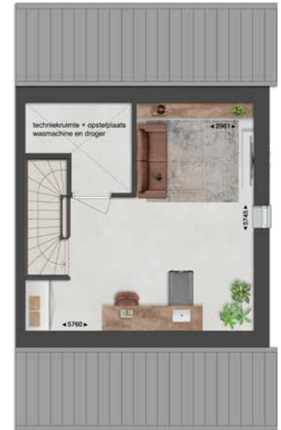
TWEDE VERDIEPING - BNR 45

* Kapvormen wisselen per bouwnummer, getoond is een langskap.