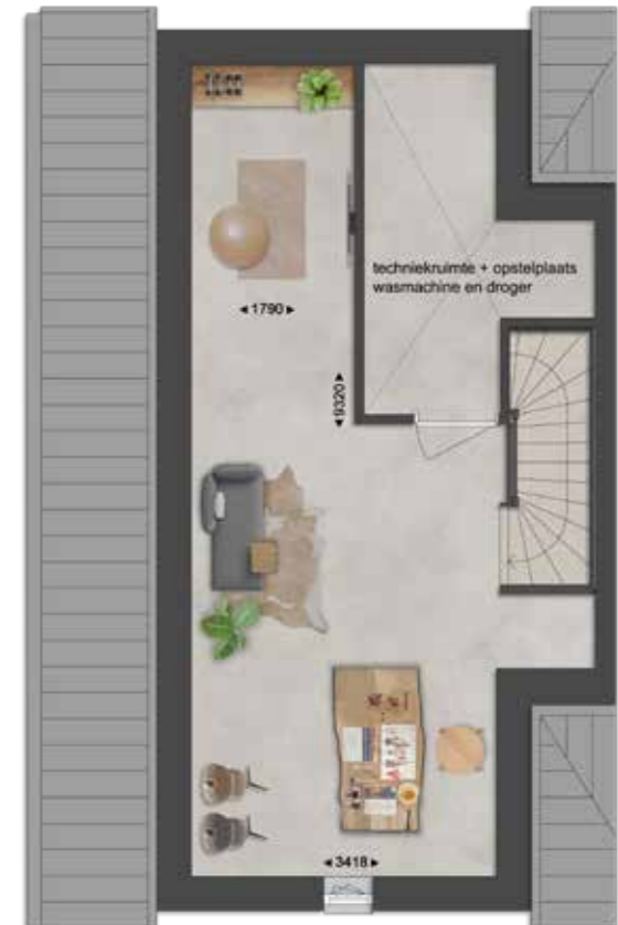
TWEDE VERDIEPING - BNR 12

* Kapvormen wisselen per bouwnummer, getoond is een langskap.